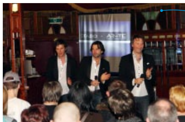
De Romeo's zetten de tent in vuur en vlam.